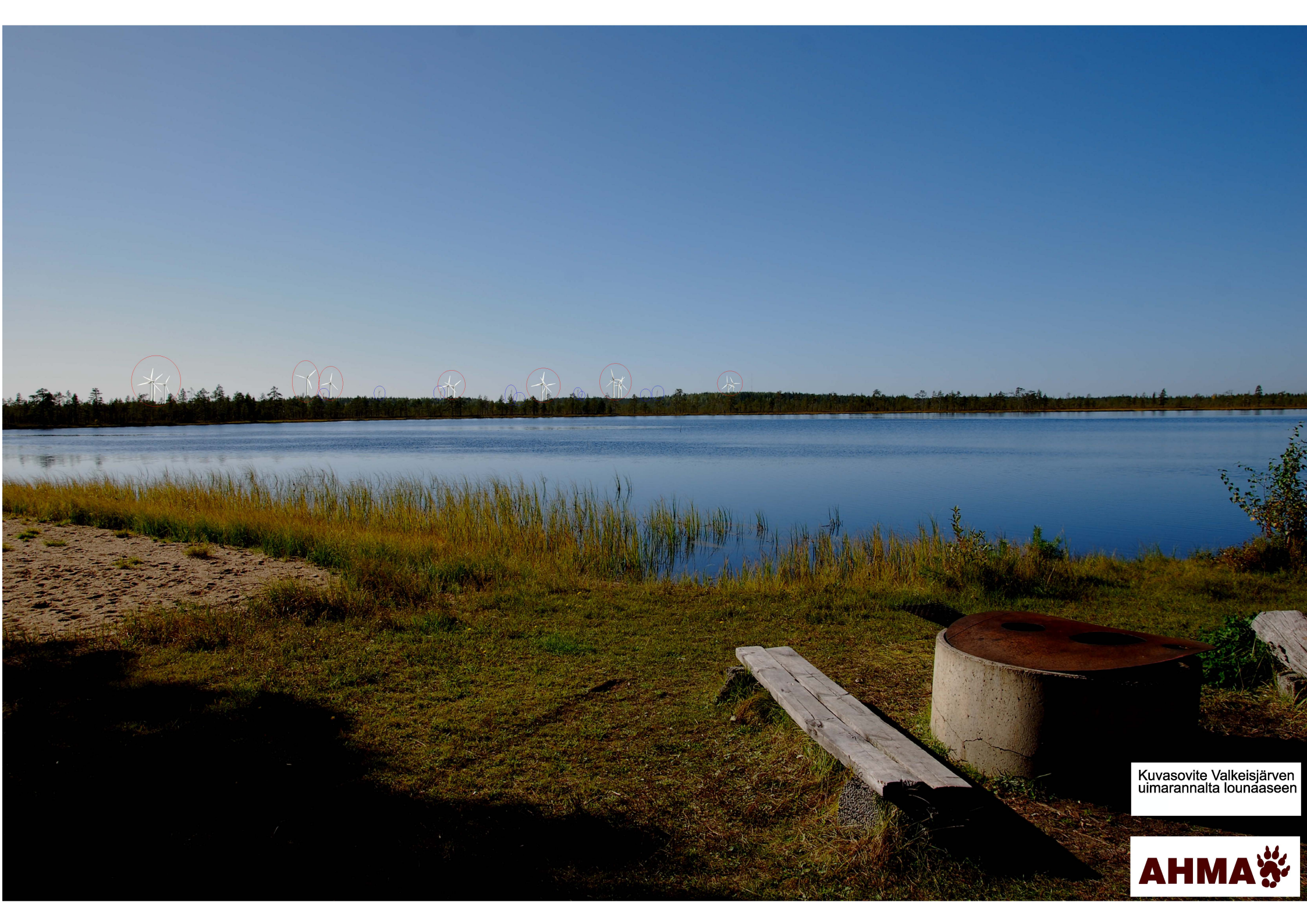
Kuvasovite Valkeisjärven uimarannalta lounaaseen