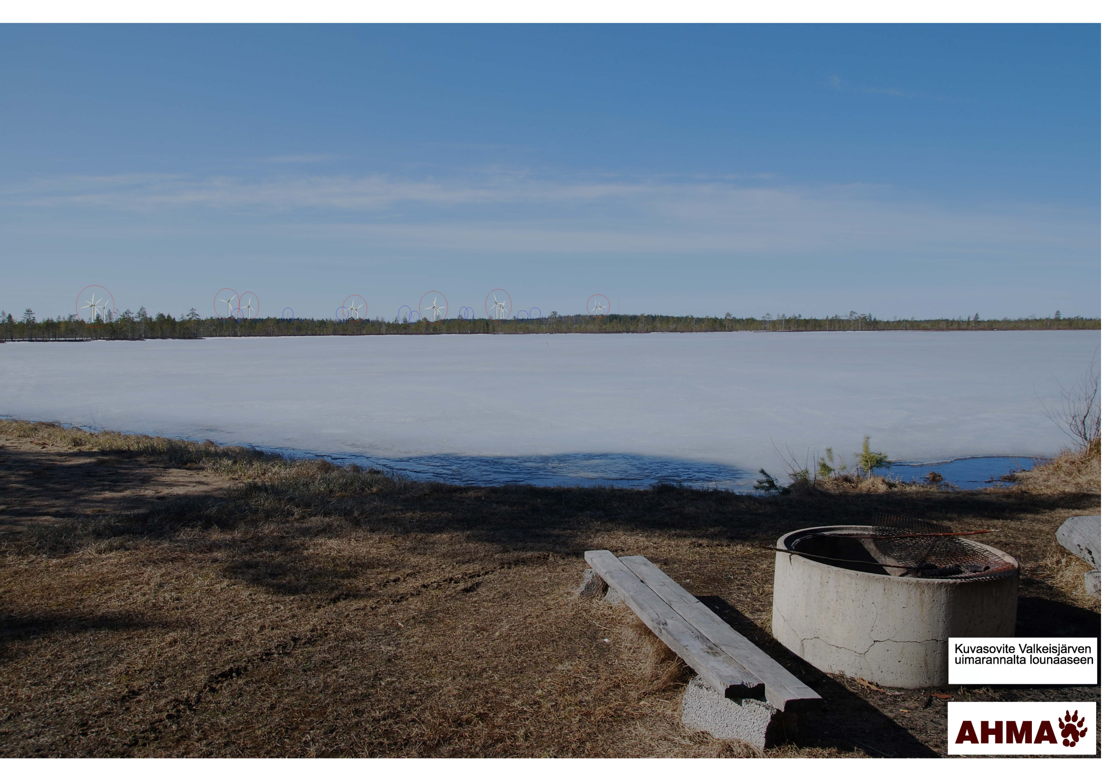
Kuvasovite Valkeisjärven uimarannalta lounaaseen