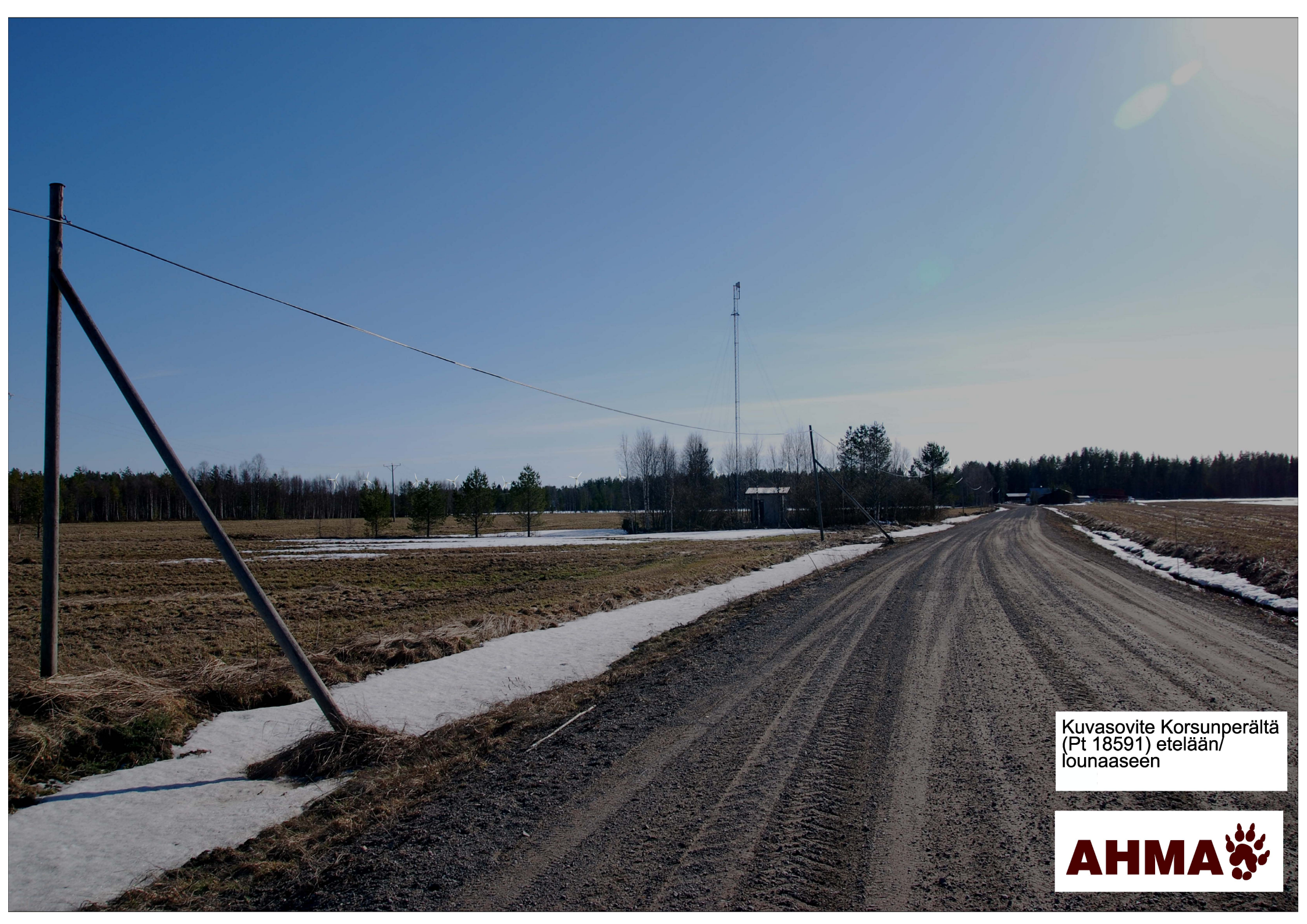
Kuvasovite Korsunperältä (Pt 18591) etelään/ lounaaseen