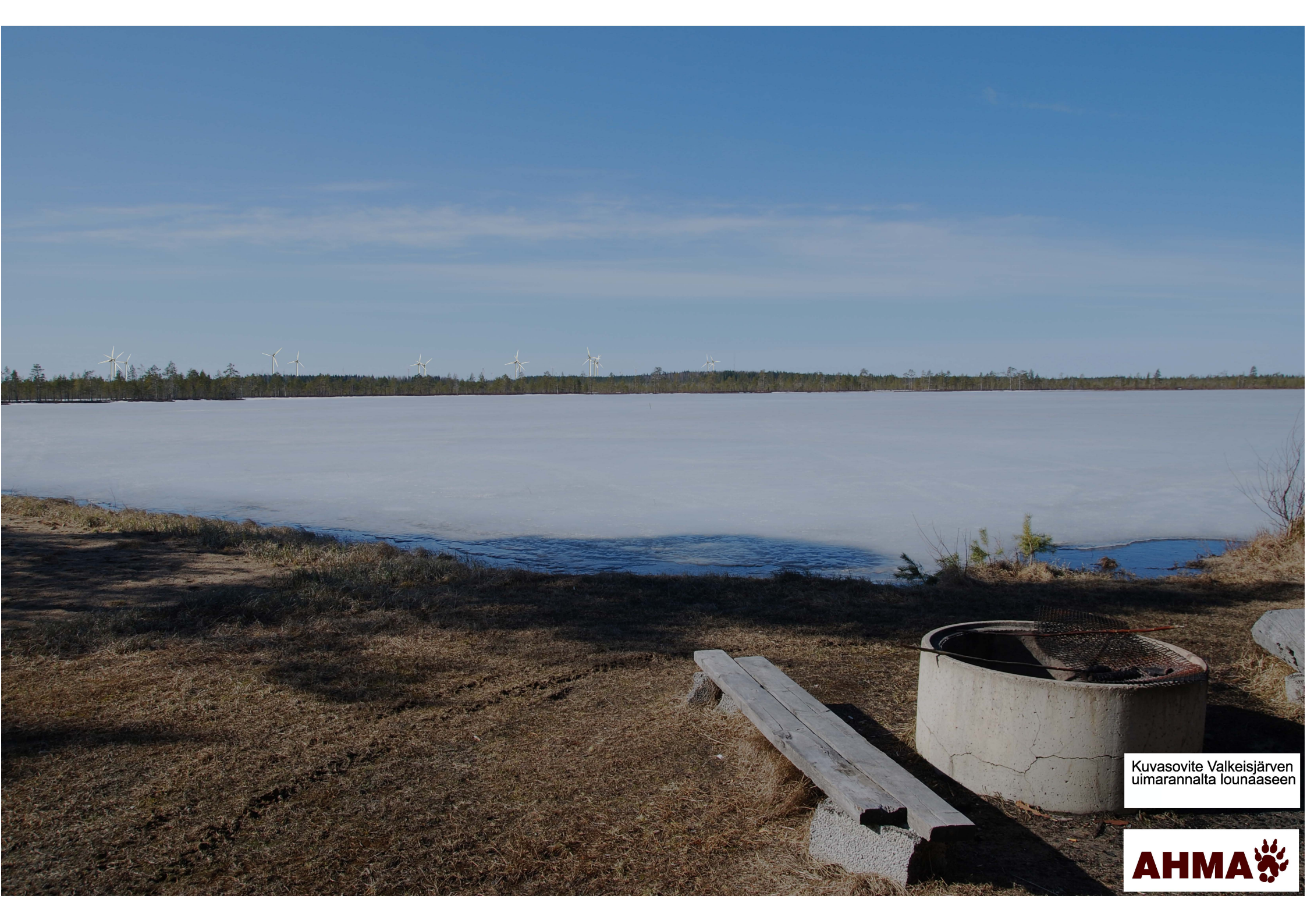
Kuvasovite Valkeisjärven uimarannalta lounaaseen