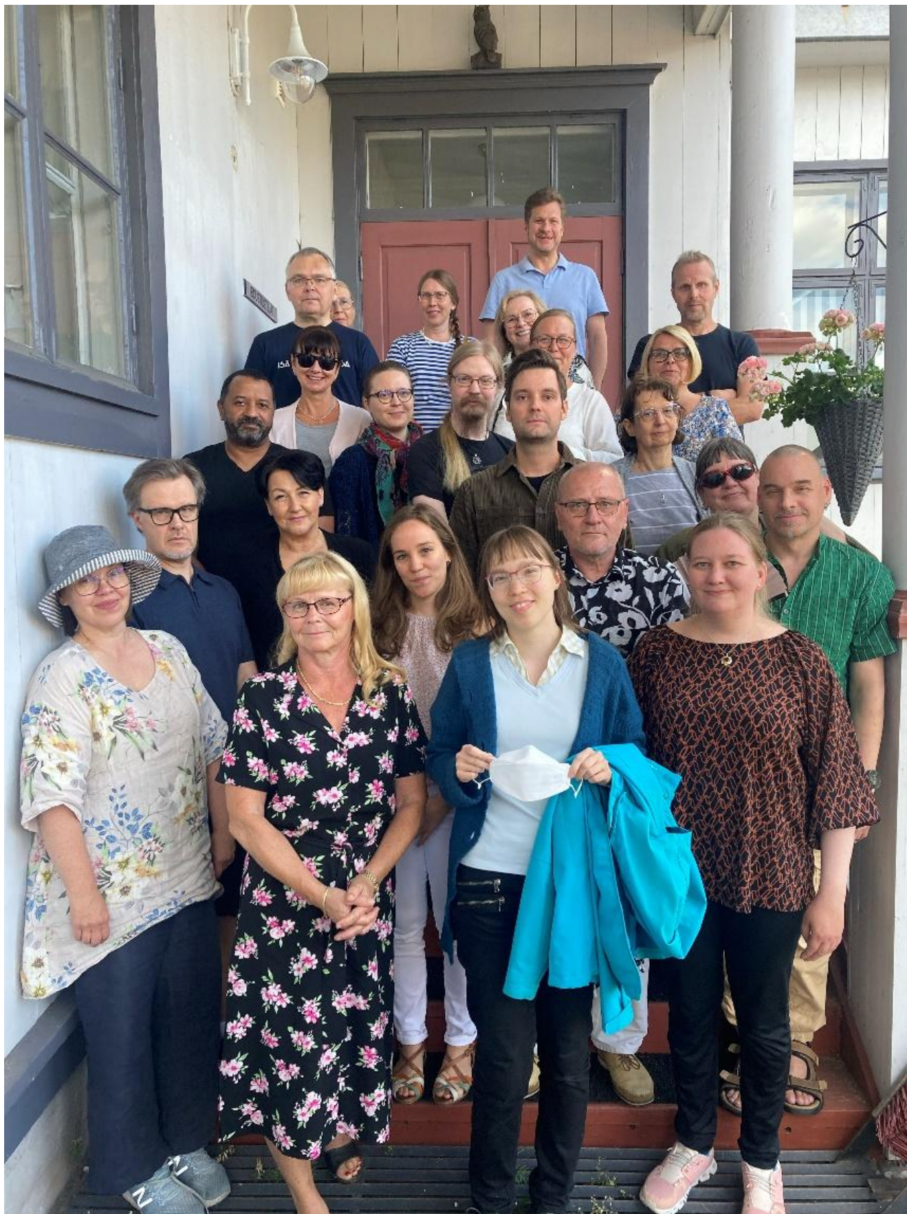
Raahen musiikkiopiston henkilökunta kiittää lukuvuodesta 2023-2024!