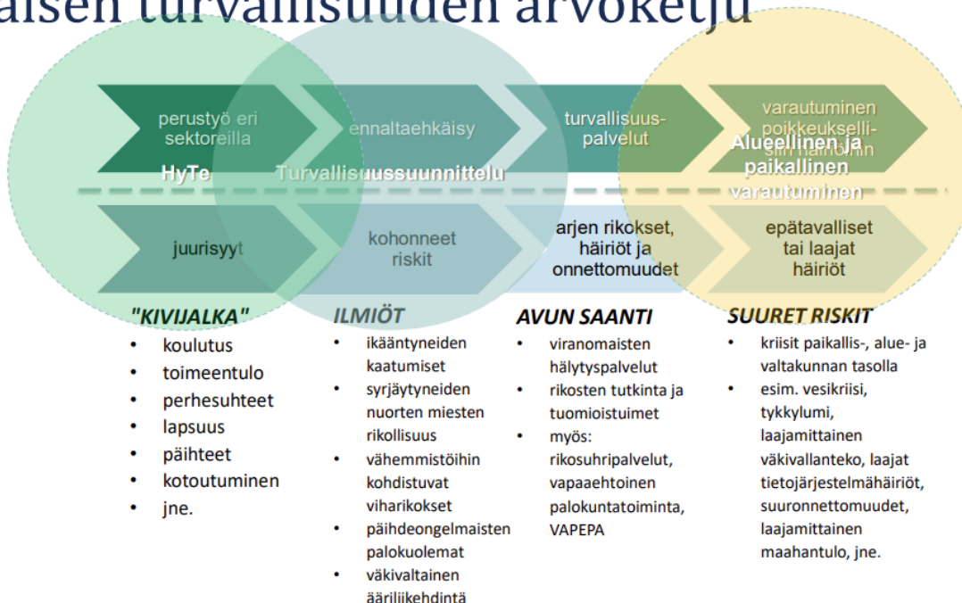
Kuva1 Sisäisen turvallisuuden arvoketju. 1