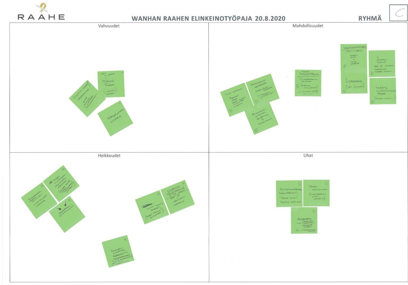
Kuva 3: Nelikenttäanalyysi

Seuraavassa vaiheessa valittiin kolme tärkeintä teemaa, joita arviointiin ryhmissä nelikenttäanalyysin avulla. Analyysissä sai käyttää useita näkökulmia ja niitä tuli avata SWOT-kenttiin (esim. toimintojen synergiat, kilpailutilanne, saavutettavuus, tunnettavuus, investoinnit). Tuloksissa painotetaan toteuttamiskelpoisuutta. Työvaiheen keskeisenä tavoitteena oli pohtia ideoita, jotka vievät alueen kehitystä eteenpäin?