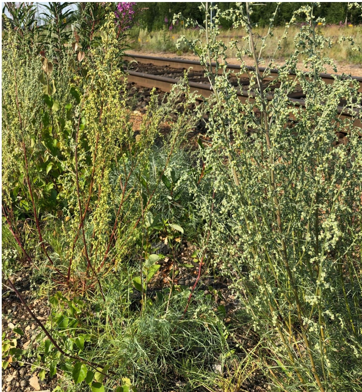
Perämerenketomarunaa ( Artemisia campestris subsp. bottnica ) sekä silo- ja perämerenketomarunan risteymää.

Paikalla havaitsin vain kaksi yksilöä perämerenketomarunaa . Runsaammin paikalla kasvaa siloketomarunan ( A. campestris subsp. campestris ) ja perämerenketomarunan välistä risteymää, jota paikalla oli seitsemän yksilöä. Yksi kasvusto on siloketomarunaa.